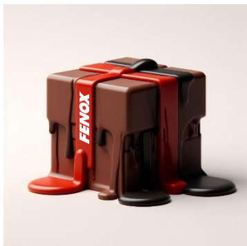
Подарки с символикой FENOX