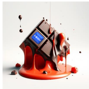
Подарочная карта Ozon