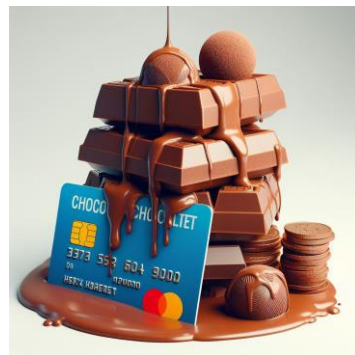
Пополнение банковской карты Участника